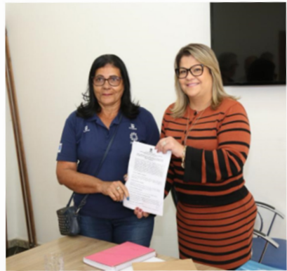
Registro de destinação do terreno em São Francisco do Itabapoana

Ainda em julho, ocorreu a I Feira da Economia do Mar no Parque de Exposições Latiff Mussi, em Macaé, com a participação de pessoas pescadoras e técnicas do Pescarte apresentando o projeto e suas ações em um stand.