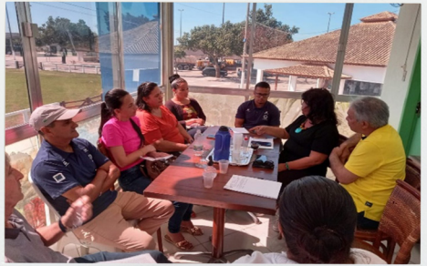
Reunião de articulação na Secretaria de Meio Ambiente em Quissamã

Em setembro, ocorreu uma reunião de articulação na sede da Secretaria de Meio Ambiente, Agricultura e Pesca de Quissamã, com participação de representantes dos PEA Pescarte e Territórios do Petróleo, da Organização Não Governamental (ONG) EcoAnzol, de uma pesquisadora da cultura local e de lideranças da comunidade de pesca artesanal. O encontro serviu para a apresentação de propostas voltadas ao meio ambiente e à pesca artesanal para o orçamento público de 2024.