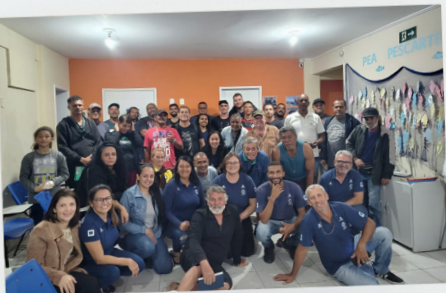
Assembleia de Constituição da Cooperativa em Arraial do Cabo