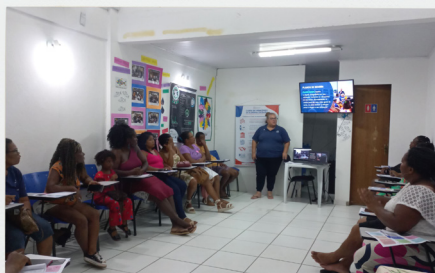
Oficina de Políticas Públicas e Direitos Sociais em Armação dos Búzios