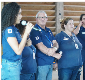
Pesquisa sendo apresentada em São Francisco do Itabapoana