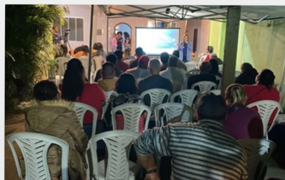
Assembleia Comunitária em Macaé