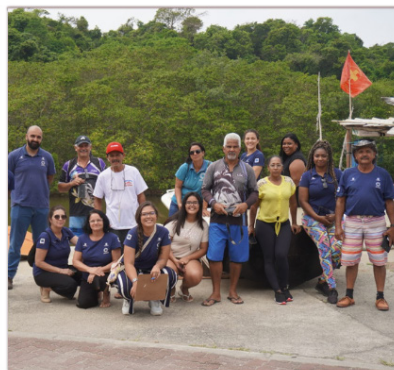
Oficina Colaborativa do Livro de 10 anos em Rio das Ostras

Nesse período, também ocorreu o encontro semestral do GAO Integrador, que reúne representantes do GAO e GG para dialogarem e trocarem experiências, e uma rodada de Assembleias Comunitárias em cada município, sendo estas um espaço de devolutiva às comunidades sobre as atividades realizadas nos meses anteriores. Foram realizadas, ainda, a aplicação de diversas oficinas em todo o território de abrangência do Pescarte. Abaixo, você pode conferir algumas fotos: