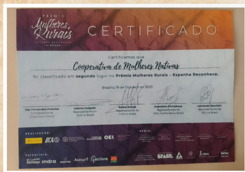
Certificado da premiação