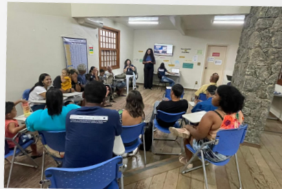
13ª Reunião do GAO em Campos dos Goytacazes