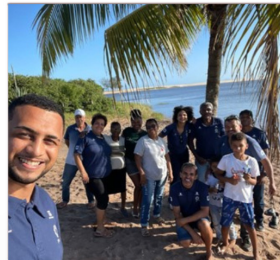
Oficina de Cooperativismo em Carapebus