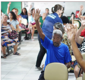
Assembleia Comunitária em Campos dos Goytacazes

Assim, respondendo ao mistério do início desse texto: fazer tanta coisa acontecer em apenas um ano só foi possível por causa da essência colaborativa do Pescarte, que deixa claro o quanto é importante unirmos forças para seguir em frente, valorizando toda contribuição dada pela equipe do projeto e, claro, pelas pessoas integrantes das comunidades pesqueiras, que são, ao mesmo tempo, nosso combustível e nossa linha de chegada.