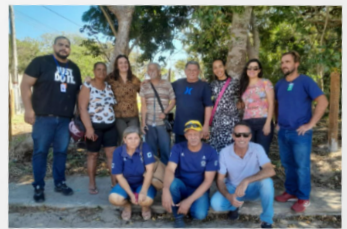
Entrega do cercamento do Terreno no Guriri em Cabo Frio